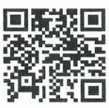
QR-Code ประกาศรับสมัคร