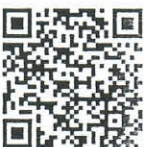
QR Code ใบสมัคร