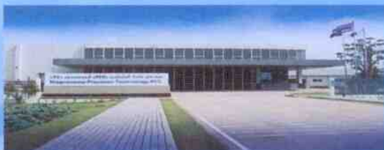
Magnecomp Thailand (Wangnoi Plant) Suspension Assemblies