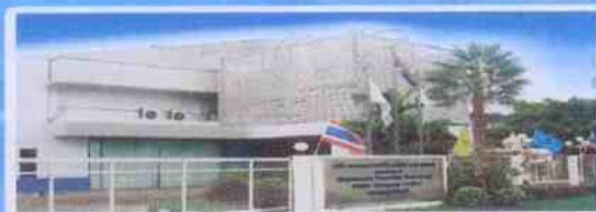
Magnecomp Thailand (Rojana Plant) Suspension Assemblies

Headquarters (Thailand) 162 Moo 5 Phaholyothin Road, T.Lamsai, A.Wangnoi, Ayutthaya 13170 Thailand Tel: (66) 35-215-225 Fax: (66) 35-215-378