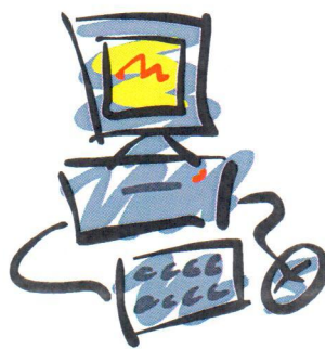
นางงาน ว่างจากเบื่องาน คลิกเลยที่ www.lepan.co.th

ต้องการรับสมัครเพื่อนร่วมงานจำนวนมาก ดูตำแหน่งงานที่เปิดรับ หรือสนใจสมัครงาน สามารถกรอกประวัติ Online ได้ที่