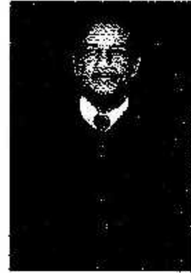
นายสมยศ วัฒนภิรมย์ อธิบดีศาลปกครองภูเก็ต