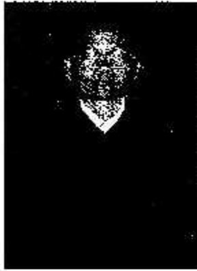
นายเสถียร ทิวทอง อธิบดีศาลปกครองชั้นต้น ประจำศาลปกครองสูงสุด