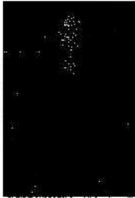
นายกุศล รักษา อธิบดีศาลปกครองนครราชสีมา

หากท่านผู้ใดมีข้อมูล ข้อเท็จจริง และข้อคิดเห็นเกี่ยวกับบุคคลผู้ที่ได้รับการเสนอชื่อให้ดำรงตำแหน่งตุลาการศาลปกครองสูงสุด