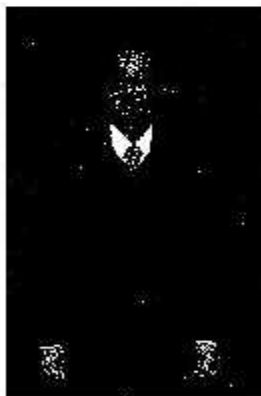
นายณัฐ รัธอมถด อธิบดีศาลปกครองกลาง