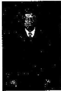
นายไพโรจน์ มินเด็บ อธิบดีศาลปกครองสงขลา