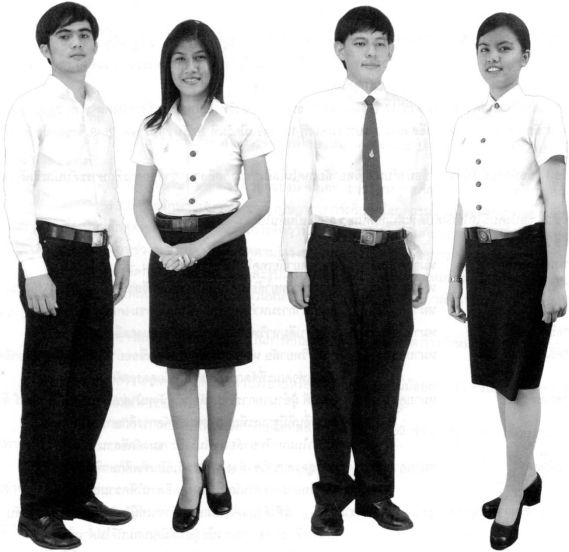
ระดับ ปวส.