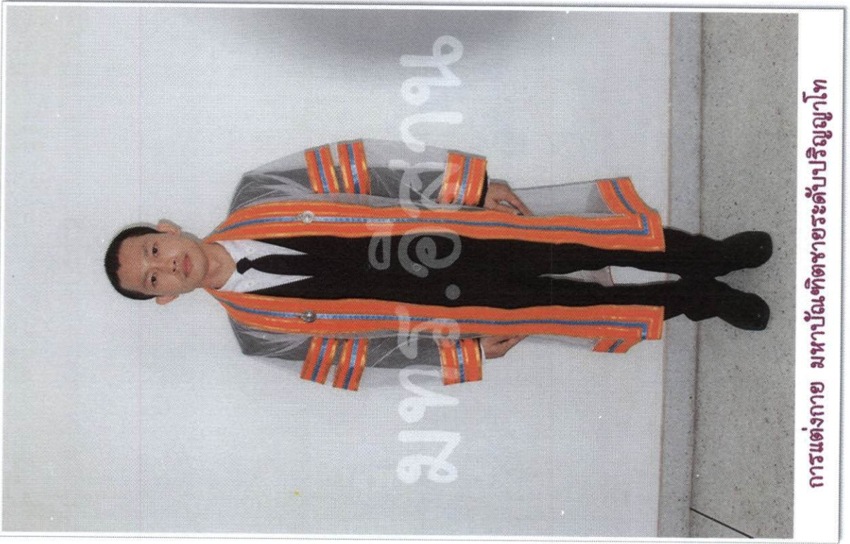
การแต่งกาย มหาบัณฑิตชายระดับปริญญาโท