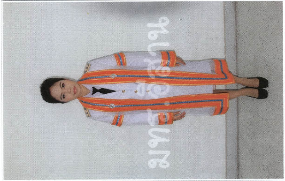
การแต่งกาย ปณทิตหญิงข้าราชการ ระดับปริญญาตรี