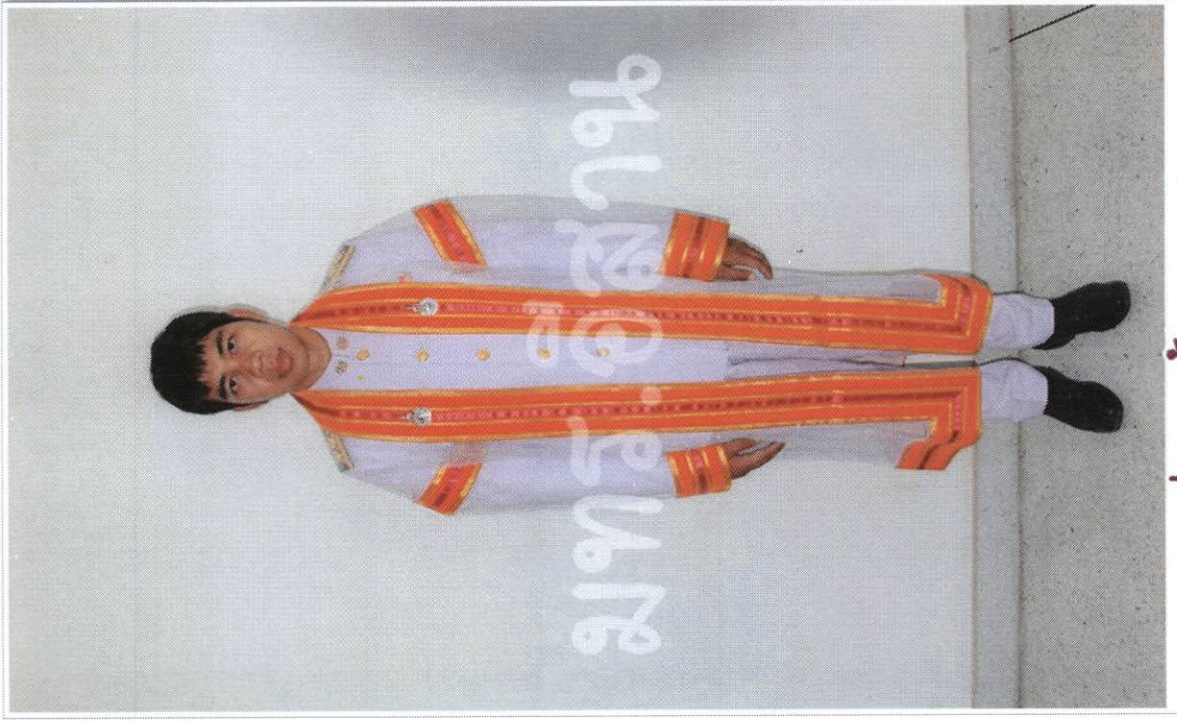
การแต่งกาย ข้าราชการชาย