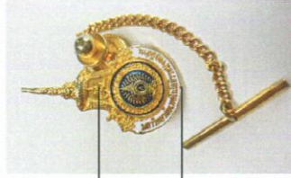
เครื่องหมายติดปกเสื้อ