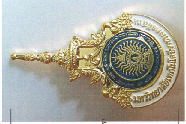
เข็มกลัดติดเสื้อตราสัญลักษณ์