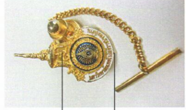
เข็มกลัดติดเนคไท